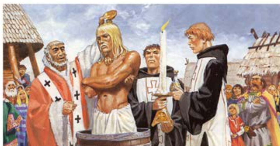
Chrzest króla Franków Chlodwiga z dynastii Merowingów w 496 roku.

Rys. P.Joubert, w: „W czasach wikingów (793-1066).