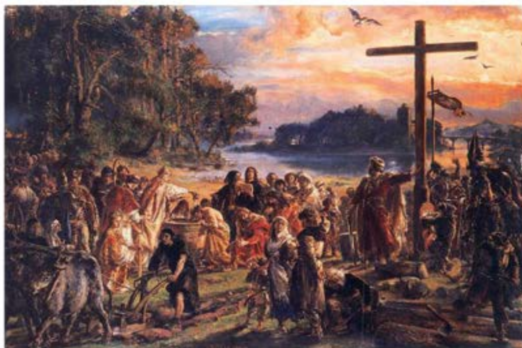
Jan Matejko, Zaprowadzenie chrześcijaństwa w Polsce