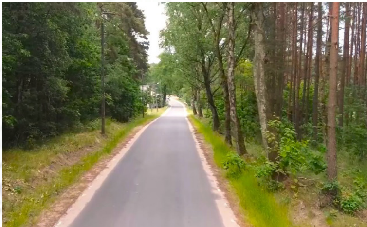
Droga Drawno - Zdanów