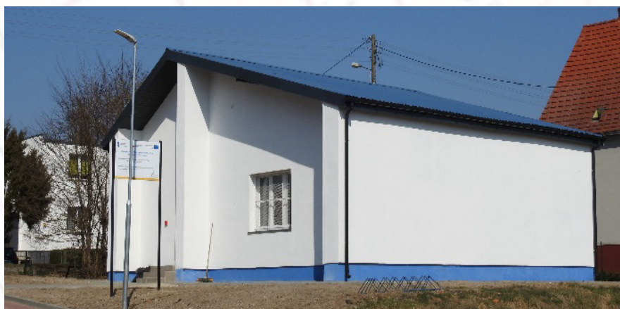
Szatnia sportowa w Drawnie

W ramach inwestycji dokonano przebudowy, budowy i remontów obiektów turystycznych i rekreacyjnych nad jeziorem Adamowo. Powstały nowe ciągi komunikacyjne wraz z elementami ścieżki zdrowia, wykonano oświetlenie ledowe, wyremontowano hangar oraz szatnię sportową. Wykonano drogę wewnętrzną. Wartość całkowita zadania: ok. 2,4 mln zł (dofinansowanie w wysokości 85%).