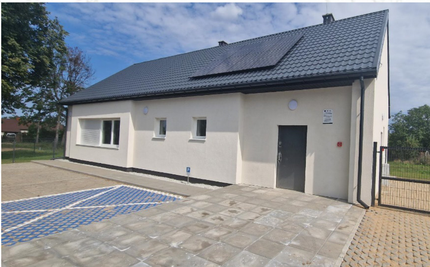
Świetlica w Konotopiu, fot. arch. UM Drawno

Wartość całkowita zadania: ok. 900 tys. zł (dofinansowanie w wysokości 500 tys. zł)