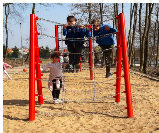
Zabawy w parku