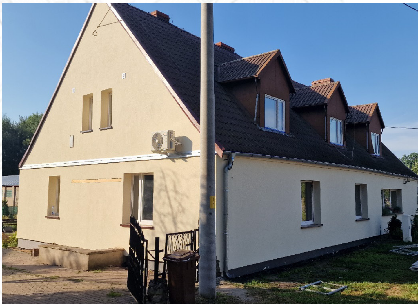
Remont świetlicy w Brzezinach

Wartość całkowita zadania: ok. 625 tys. zł (dofinansowanie w wysokości 63,63%).