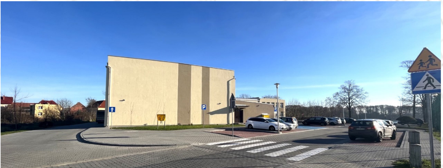
ul. Żeromskiego w Drawnie