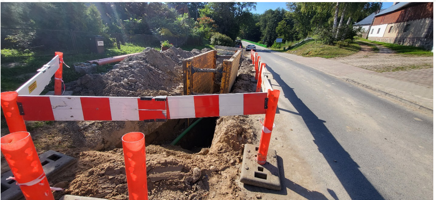
Kanalizacja w Barnimiu, fot. arch. UM Drawno