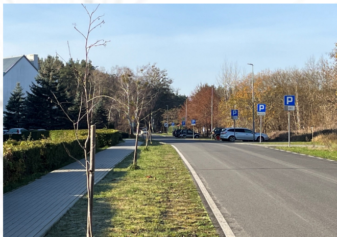
Osiedle Leśników w Drawnie

Łącznie ponad 2,5 km dróg. Wartość całkowita zadania: ok. 4,5 mln zł (dofinansowanie w wysokości 50%)