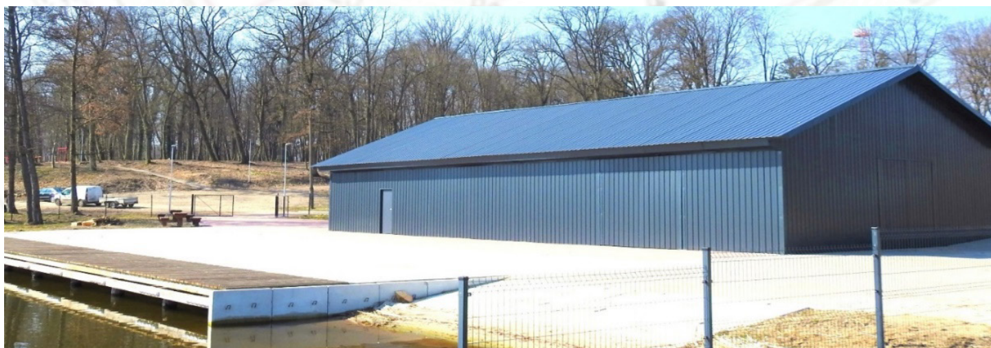
Hangar nad jeziorem Adamowo w Drawnie

W przyszłych latach zaplanowano kontynuację zagospodarowywania parku za boiskiem w ramach projektu pn. „Roboty budowlane i porządkowe na terenie dawnego cmentarza ewangelickiego - część zachodnia”. Wartość zadania ok. 0,5 mln zł , dofinansowanie w wysokości 98% z Polskiego Ładu.