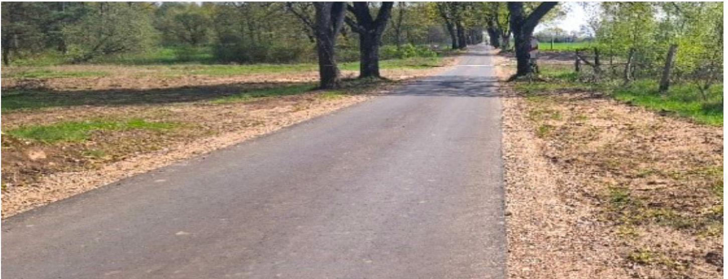
Droga do Sieniawy

Wartość całkowita zadania: ok. 3,4 mln zł (dofinansowanie w wysokości 95%)