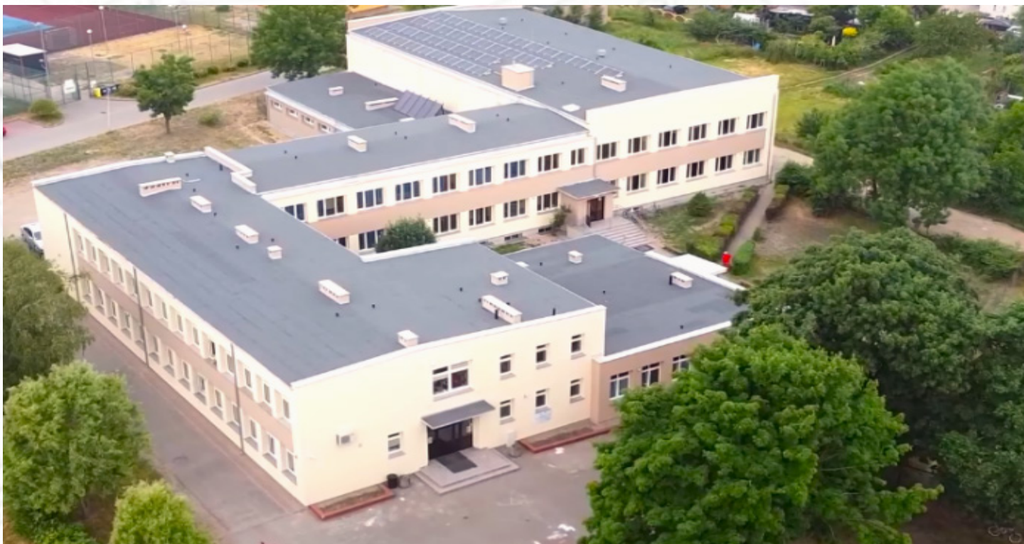
Szkola podstawowa w Drawnie

Wartość całkowita zadania: ok. 4,2 mln zł (dofinansowanie w wysokości 90%)