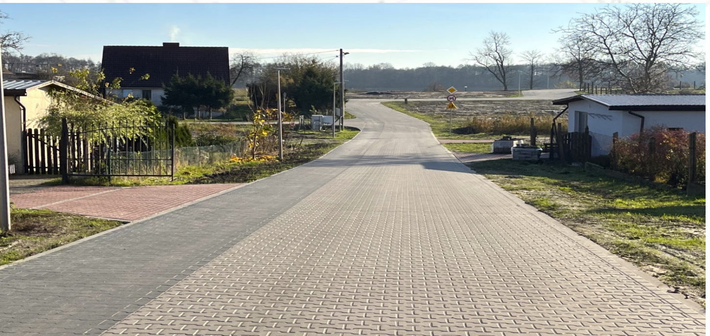
ul. Wczasowa w Drawnie