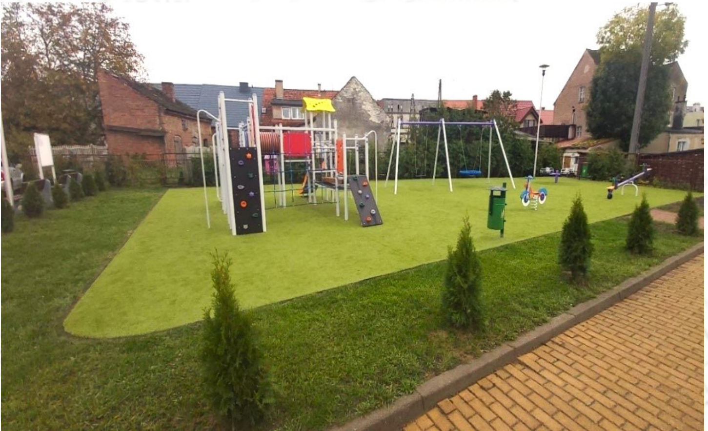
Plac zabaw przy DOK

Wartość całkowita zadań: ok. 220 tys. zł (dofinansowanie w wysokości 63,63%)