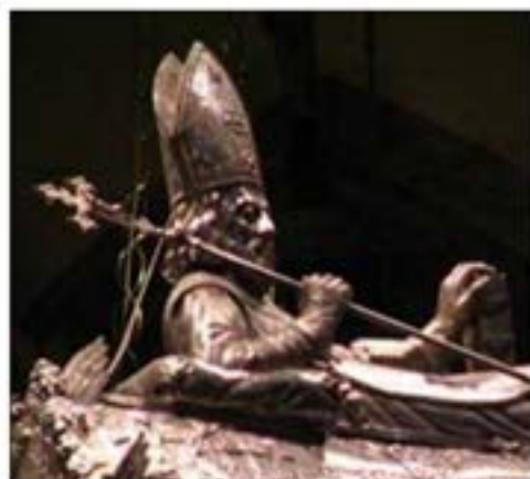
Św. Wojciech na relikwiarzu w katedrze gnieźnieńskiej.

W katedrze gnieźnieńskiej zachowały się do dzisiaj „Drzwi Gnieźnieńskie” z drugiej połowy XII wieku. Jest to jeden z najcenniejszych zabytków sztuki romańskiej w Polsce. Na dwóch skrzydłach drzwi umieszczono kwatery przedstawiające epizody z życia św. Wojciecha, misjonarza, którego wysłał do Prusów w celu chrystianizacji władca polski Bolesław I Chrobry.